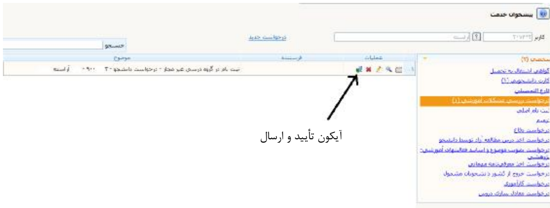
آیکون تأیید و ارسال

پس از شدن پنجره تأیید و انتخاب اعمال تغییرات ثبت درخواست پایان می‌یابد.