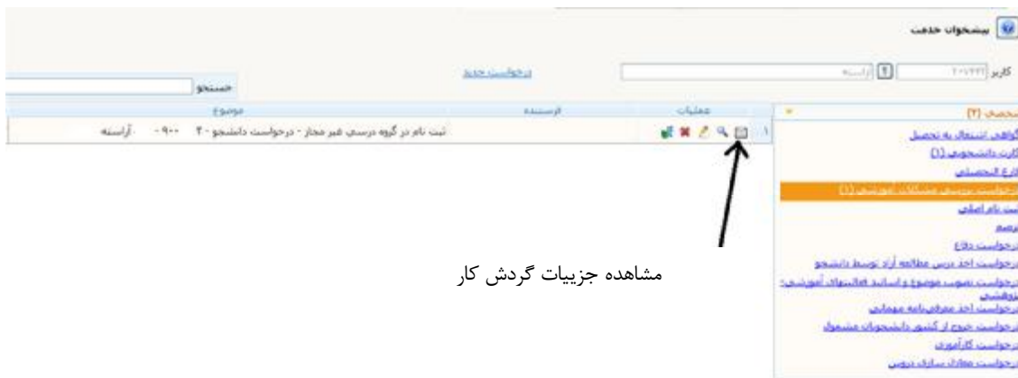
مشاهده جزئیات گردش کار

با استفاده از گزینه مشاهده جزئیات گردش کار می‌توانید درخواست خود را پیگیری نمایید.